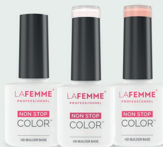
HD Builder Base