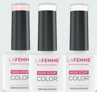
Fiber Builder Base